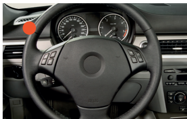
● DALTORIM IS-2, IS-4