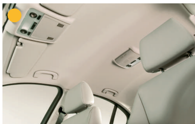
● ГРУППА СИСТЕМ ACOUSTIFLEX S