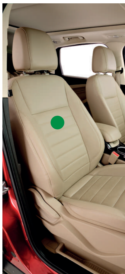
● DALTOFLEX FM